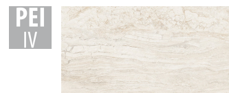
PTN001 32x62,5 cm Hrúbka 9 Balenie obsahuje 1 m 2 , 5