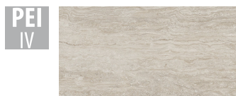
PTN002 32x62,5 cm Hrúbka 9 Balenie obsahuje 1 m 2 , 5