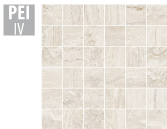
PTN010 30x30 cm Hrúbka 9 Balenie obsahuje 1 m 2