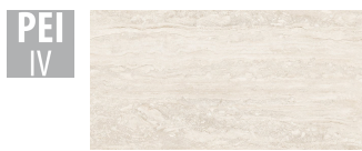
PTN007 59,1x119,1 cm Hrúbka 11 Balenie obsahuje 1.41 m 2 , 2