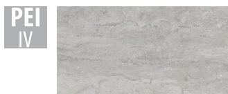
PTN003 32x62,5 cm Hrúbka 9 Balenie obsahuje 1 m 2 , 5