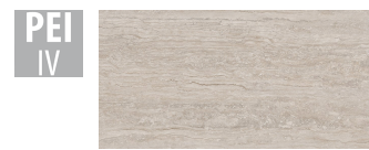
PTN008 59,1x119,1 cm Hrúbka 11 Balenie obsahuje 1.41 m 2 , 2