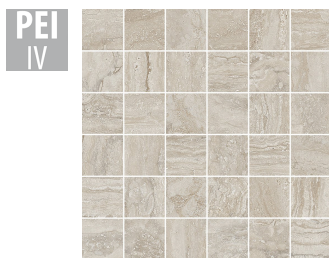
PTN011 30x30 cm Hrúbka 9 Balenie obsahuje 1 m 2