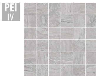
PTN012 30x30 cm Hrúbka 9 Balenie obsahuje 1 m 2