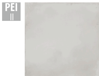
MAT006 60x60 cm Hrúbka 9.5 Balenie obsahuje 1.44 m 2 , 4