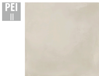
MAT008 60x60 cm Hrúbka 9.5 Balenie obsahuje 1.44 m 2 , 4