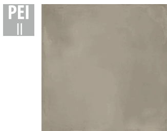
MAT009 60x60 cm Hrúbka 9.5 Balenie obsahuje 1.44 m 2 , 4