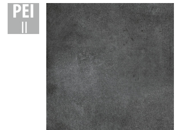
MAH004 60x60 cm Hrúbka 9.5 Balenie obsahuje 1.44 m 2 , 4