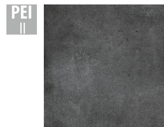
MAH004 60x60 cm Hrúbka 9.5 Balenie obsahuje 1.44 m 2 , 4