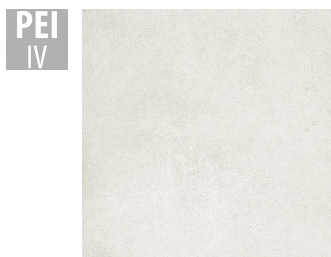
MAH001 60x60 cm Hrúbka 9.5 Balenie obsahuje 1.44 m 2 , 4