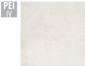
MAH001 60x60 cm Hrúbka 9.5 Balenie obsahuje 1.44 m 2 , 4