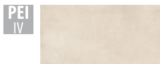
MAH006 60x120 cm Hrúbka 9 Balenie obsahuje 1.44 m 2 , 2