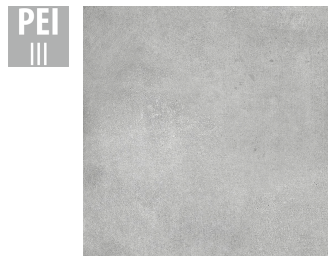
MAH003 60x60 cm Hrúbka 9.5 Balenie obsahuje 1.44 m 2 , 4