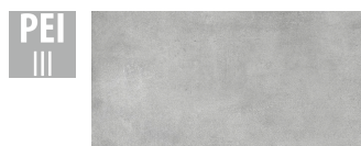
MAH007 60x120 cm Hrúbka 9 Balenie obsahuje 1.44 m 2 , 2