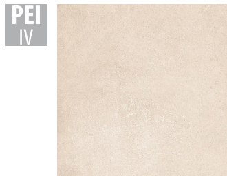
MAH002 60x60 cm Hrúbka 9.5 Balenie obsahuje 1.44 m 2 , 4