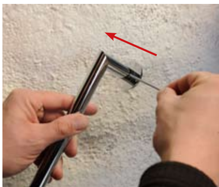
1. Sestavení madla 1. Assembly the handrail