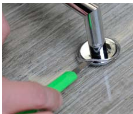
9. Odříznutí přebytečného lepidla mezi 25 až 30 minutou 9. Remove the excess glue after 25-30 minutes