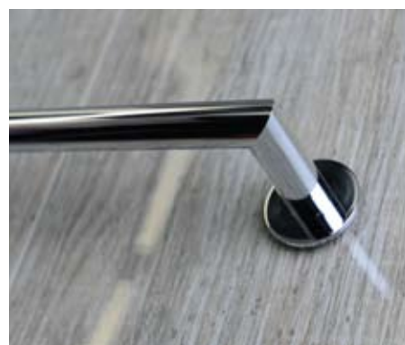
10. Před použitím madla nechte lepidlo vytvrdnout 24 hodin 10. Leave the glue harden for another 24 hours before using the handrail