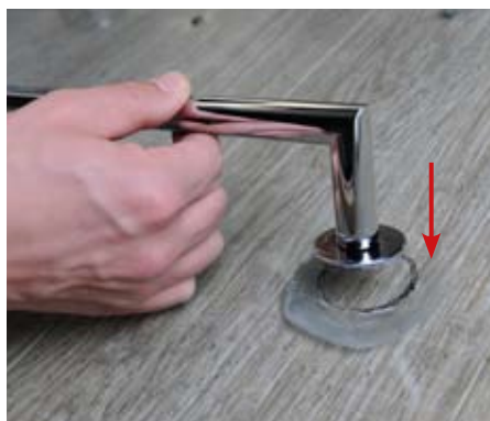
7. Usazení madla 7. Fix the handrail