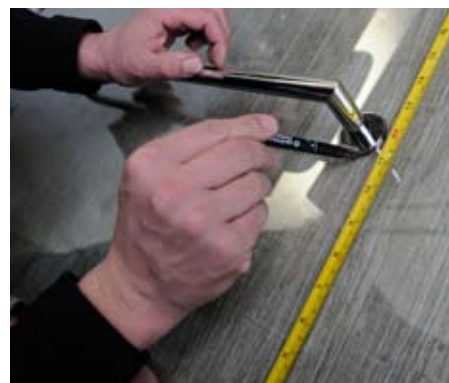
3. Označení místa lepení 3. Mark the place of sticking