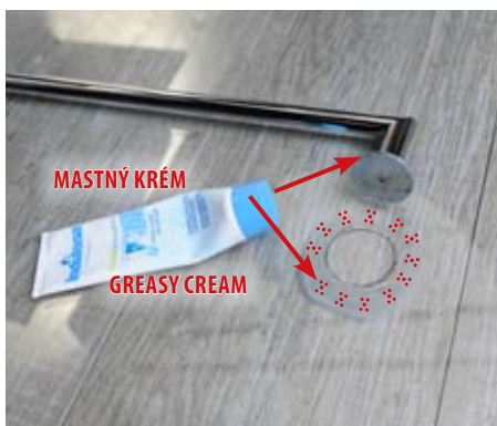
4. Separace okolních ploch skla a obvodu madla 4. Separate the surrounding areas of glass and the handrail edges