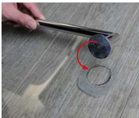
7. Usazení madla 7. Fix the handrail