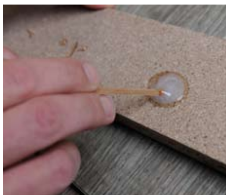
5. Rozmíchání dvousložkového lepidla 5. Mixing of two-component glue.