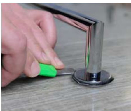
9. Odříznutí přebytečného lepidla mezi 25 až 30 minutou 9. Remove the excess glue after 25-30 minutes