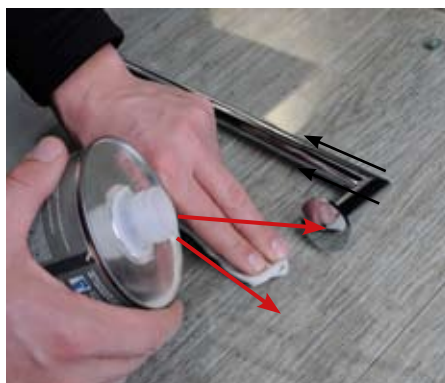
2. Odmaštění styčných ploch 2. Degrease the contact surfaces