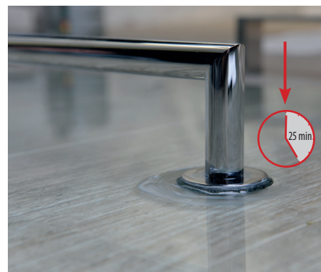
8. Tvrdnutí lepidla 25 minut 8. Let the glue dry for 25 minutes