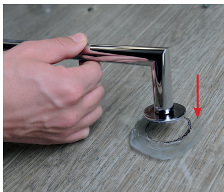
7. Usazení madla 7. Fix the handrail