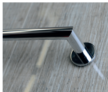
10. Před použitím madla nechte lepidlo vytvrdnout 24 hodin 10. Leave the glue harden for another 24 hours before using the handrail