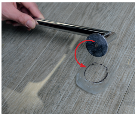
7. Usazení madla 7. Fix the handrail