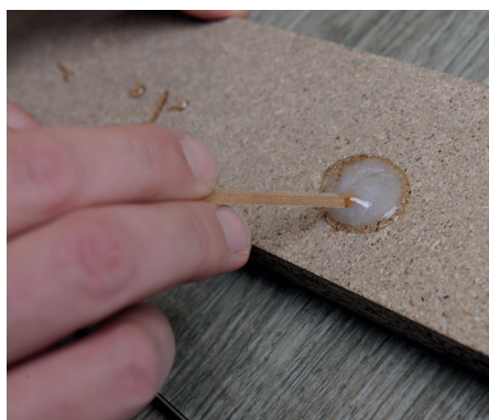
5. Rozmíchání dvousložkového lepidla 5. Mixing of two-component glue.