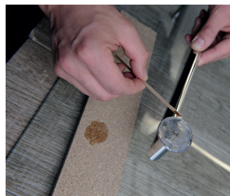
6. Nanesení 2 mm silné vrstvy lepidla 6. Apply a 2mm layer of glue