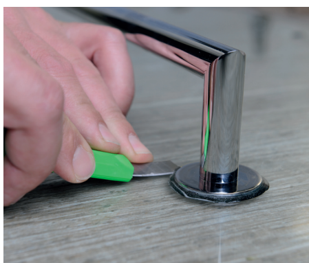
9. Odříznutí přebytečného lepidla mezi 25 až 30 minutou 9. Remove the excess glue after 25-30 minutes