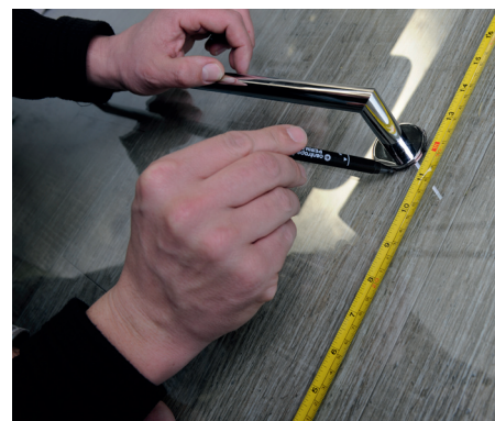
3. Označení místa lepení 3. Mark the place of sticking