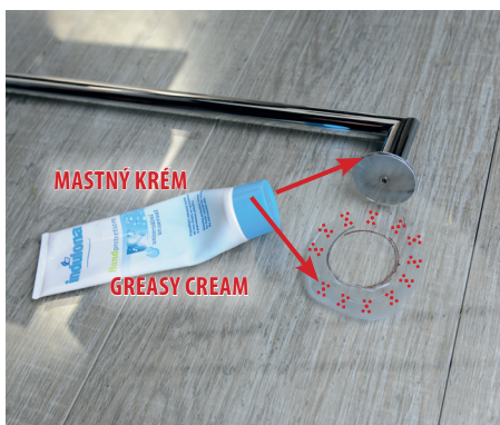
4. Separace okolních ploch skla a obvodu madla 4. Separate the surrounding areas of glass and the handrail edges