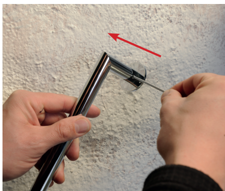
1. Sestavení madla 1. Assembly the handrail