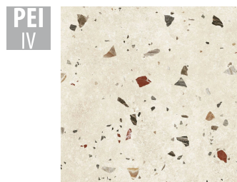
SNR002 66x66 cm Dicke 10 Verpackung enthält 1.31 m 2 , 3