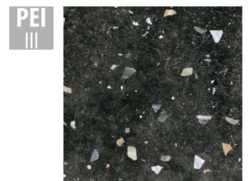
SNR004 66x66 cm Dicke 10 Verpackung enthält 1.31 m 2 , 3