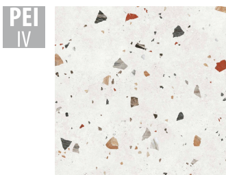
SNR001 66x66 cm Dicke 10 Verpackung enthält 1.31 m 2 , 3